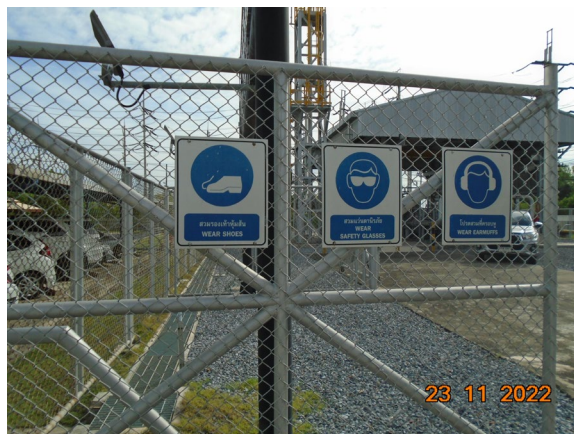
ภาพที่ 2-7 ป้ายเตือนให้สวมใส่อุปกรณ์คุ้มครองความปลอดภัยส่วนบุคคล