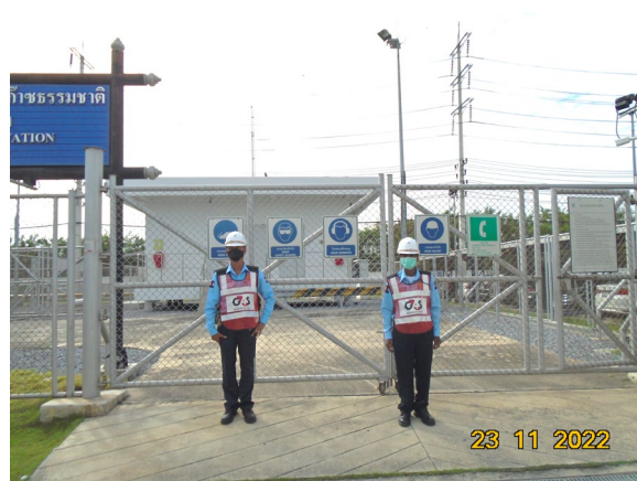
ภาพที่ 2-5 เจ้าหน้าที่รักษาความปลอดภัย บริเวณสถานี วัดและควบคุมแรงดันก๊าซ (MRS)