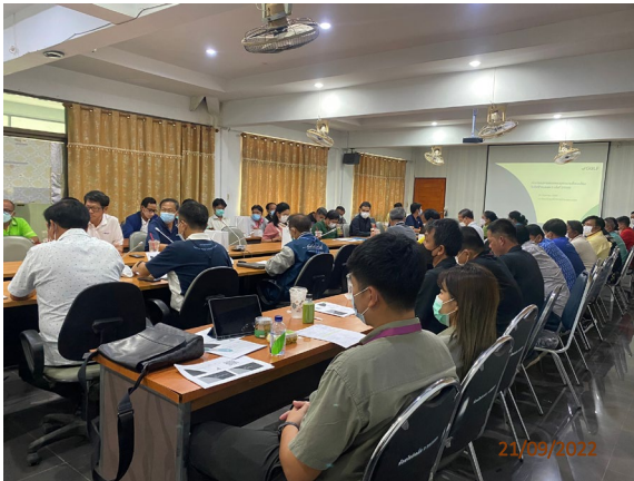
วันที่ 21 กันยายน พ.ศ. 2565