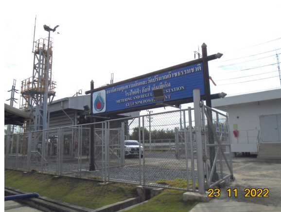
ภาพที่ 2-3 สถานีวัดและควบคุมแรงดันก๊าซ (MRS)