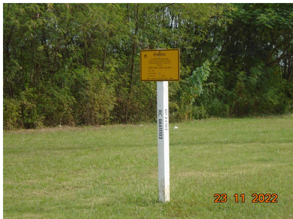
ภาพที่ 2-1 ป้ายแสดงตำแหน่งแนวท่อส่งก๊าซธรรมชาติ