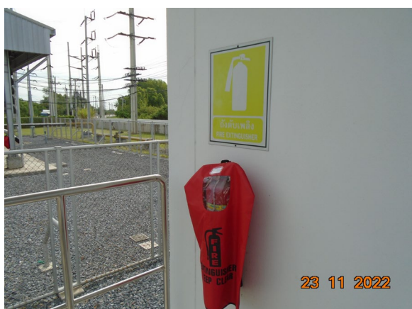
ภาพที่ 2-4 เครื่องดับเพลิงแบบเคมีผง