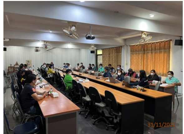
วันที่ 30 พฤศจิกายน พ.ศ. 2565